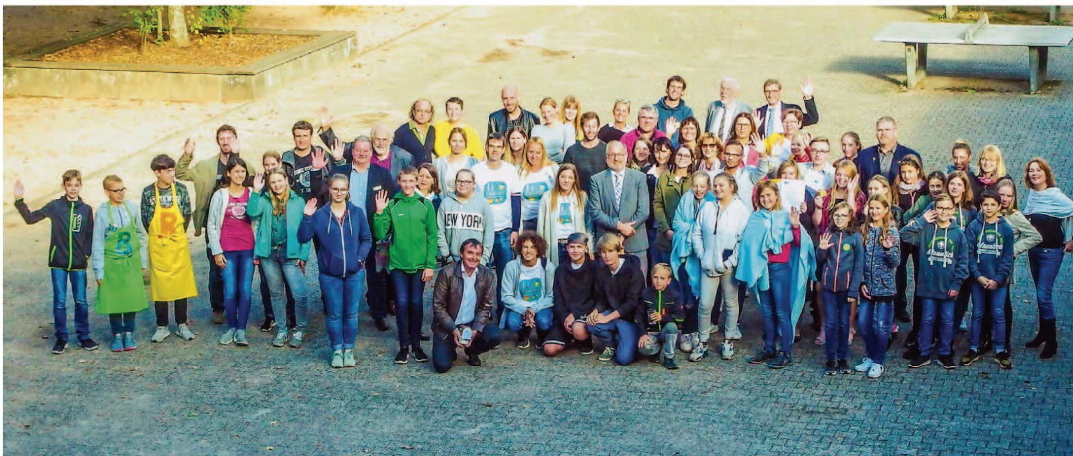
Am Ende gewinnen bei „EWA plus“ nicht nur die Schulen (unser Bild), sondern auch die Natur und Umwelt; der sorgsame Umgang mit dem Lebensumfeld ist Kern des Programms.